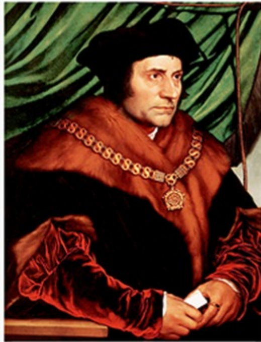
Hans Holbein de Jonge, Sir Thomas More