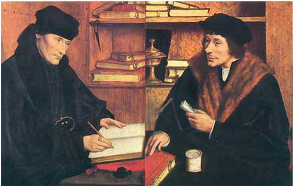
Desiderius Erasmus en Pieter Gillis door Quinten Massijs